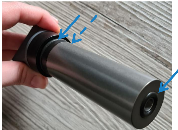
図 5: アルコールカートリッジのシールリング

アルコールカートリッジがしっかりと閉まっていることを確認します。また、アルコールカートリッジの 3 カ所の黒いシールリングを点検します。シールリングに損傷がある場合は、個々の O リングまたはアルコールカートリッジ全体を交換してください。O リングを交換するときは、潤滑のためにごく少量のグリス (ワセリンなど) を使用してください。