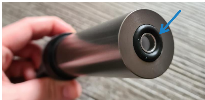
図 6: アルコールカートリッジのシールリング-詳細