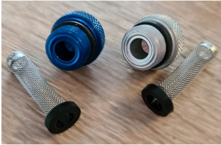
図 3: インレットポート(後)の黒いシールリング 4 およびインレットフィルタ(前)