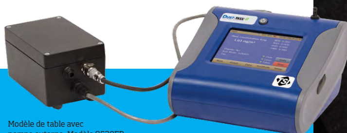
Modèle de table avec pompe externe, Modèle 8530EP

Le logiciel d'analyse des données TrakPro™ permet d'effectuer la configuration et la programmation directement à partir d'un ordinateur. Il est doté d'une nouvelle fonctionnalité de programmation et d'acquisition des données à distance à partir d'un PC par des communications sans fil (922 MHz ou 2,4 GHz) ou réseau Ethernet. Il permet d'imprimer des graphes, des tableaux de données brutes et des rapports détaillés.