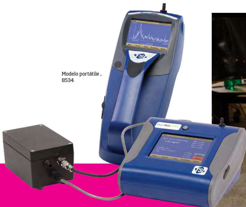
Modelo de sobremesa con bomba externa 8533EP